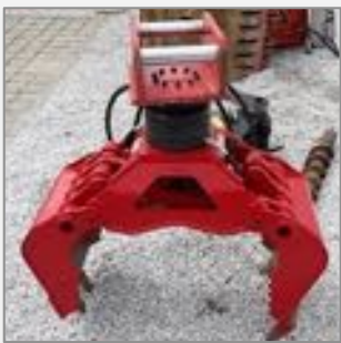
Stein Greifer UG 08