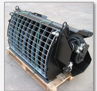
Betonlöffel für Bagger