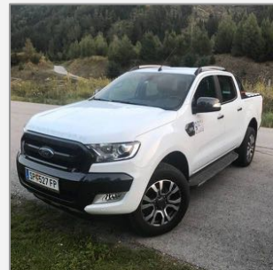
Ford Ranger Wildtrak