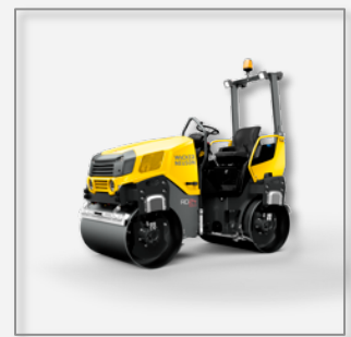
Tandemwalze RD 28