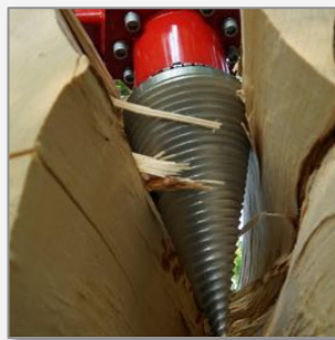
Holzspalter für Bagger