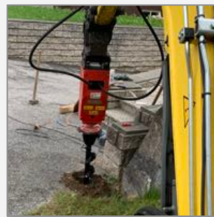
Erdbohrer für Bagger