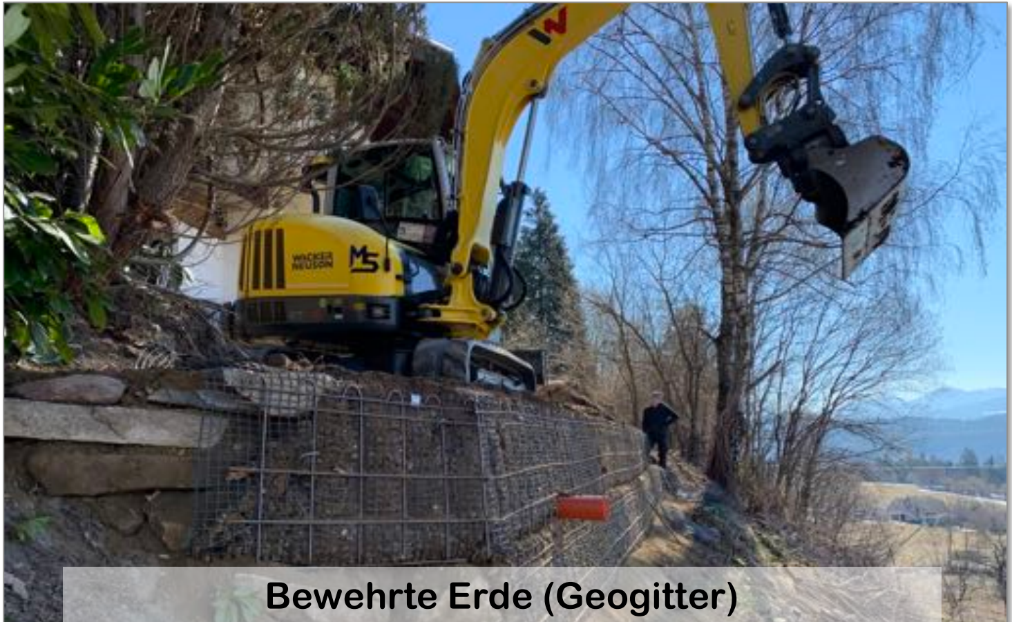
Bewehrte Erde (Geogitter)