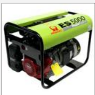
Generator 5 KW