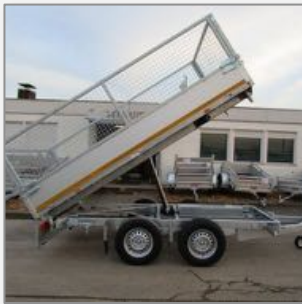
3 Seiten Kipper